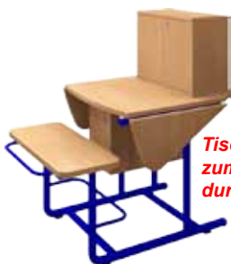
Tischflügel klappbar zum Transport z.B. durch Türen.

Die einzelnen IVALIS®-Lerninseln können wie Tortenstücke aneinandergestellt und miteinander fixiert werden, so dass mit 6 IVALIS®-Lerninseln ein Kreis gebildet wird. 3 IVALIS®-Lerninseln bilden dementsprechend einen Halbkreis.