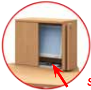
Stauraum für Tastatur und Maus