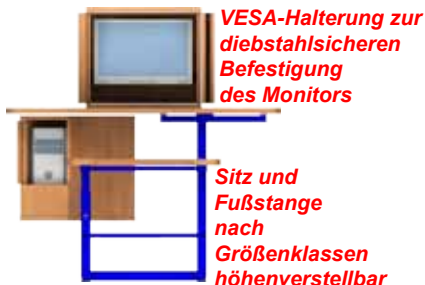
VESA-Halterung zur diebstahlsicheren Befestigung des Monitors